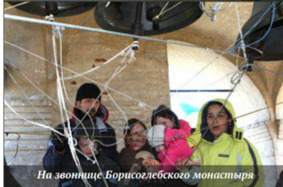
На звоннице Борисоглебского монастыря

колокола звонили не переставая несколько часов подряд! А в конце недели, мы поехали в Борисоглебский монастырь и звонили на настоящей колокольне.