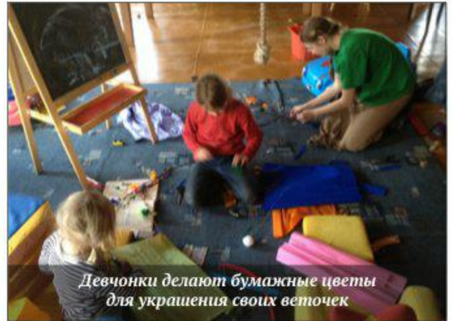
Девчонки делают бумажные цветы для украшения своих веточек

этого не знания в храмах ставили вёдра с уже освящённой вербой, которую в праздник народ разбирал и уносил по домам. Мы решили изменить эту советскую традицию, и договорились, что каждый придёт в храм уже со своими веточками, и не будет ждать, когда ему их выдадут. Получилось даже лучше, чем думали. Встречать Христа почти все пришли не просто с вербами, а ещё и нарядили их каждый на свой вкус.