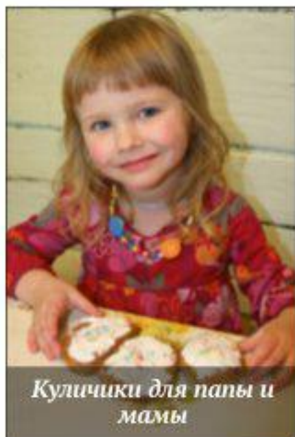
Куличики для папы и мамы

На светлой неделе, которая наступает сразу после Пасхи, тоже скучать не приходилось... Рисовали Пасхальную службу – было, что вспомнить, многие ребята были на ночном крестном ходу. На светлой неделе есть замечательный обычай: любой человек без исключения может звонить в колокола. В саму Пасху