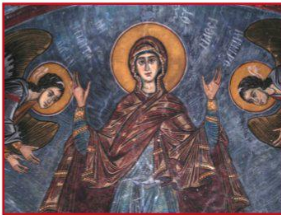
Ты же, Чистая, красуйся, Богородице (фреска в с. Асину, Кипр, XII в.)

Воскресение Христа — это величайшее событие в истории. Через Христово Воскресение жизнь и смерть приобретают совсем иной смысл. Жизнь для нас — не совокупность исторических событий, но общение с Богом, а удаление от Христа — настоящая смерть. Цель духовной жизни человека — соединение с Воскресшим Христом, созерцание Его в глубинах своего сердца.