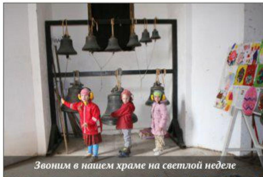
Звоним в нашем храме на светлой неделе