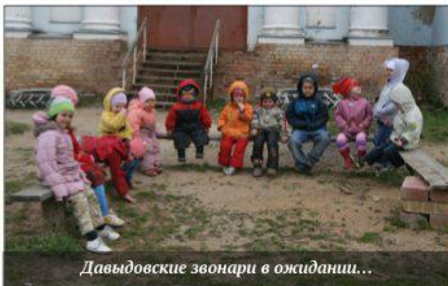
Давыдовские звонари в ожидании...

Пока мы с детьми готовили пасхальную трапезу для заключённых, родители были в храме на чтении страстных Евангелий. К концу службы мы всё доделали и пошли с детьми в храм на 9, 10, 11 и 12 Евангелие. После проповеди, все зажгли свечки-фонарики и бережно понесли домой огонь с чтения 12 Евангелий, чтобы дома зажечь лампадку перед иконами и освятить своё жилище.