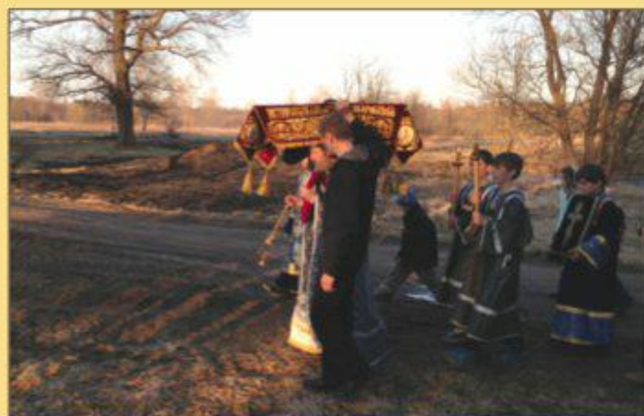
А еще в этом году чин погребением плащаницы мы совершили с новой пожертвованной плащаницей