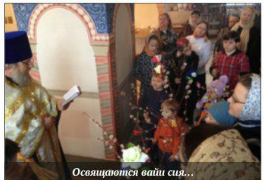
Освящаются вайи сия...