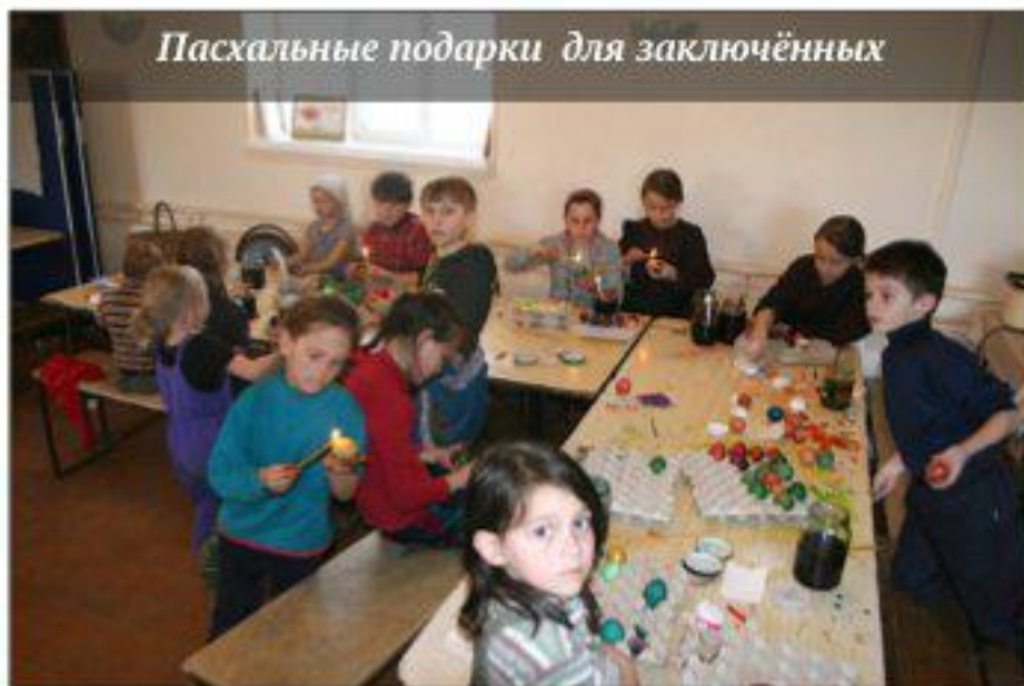
Пасхальные подарки для заключённых

Многие дети спрашивали, зачем мы будем делать подарки для тюрьмы, ведь там живут очень плохие люди? Эти вопросы создали чудесную возможность ещё раз обсудить суть христианства, что первым в рай попал как раз страшный разбойник и как же так получилось.