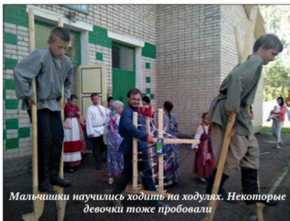
Мальчишки научились ходить на ходулях. Некоторые девочки тоже пробовали