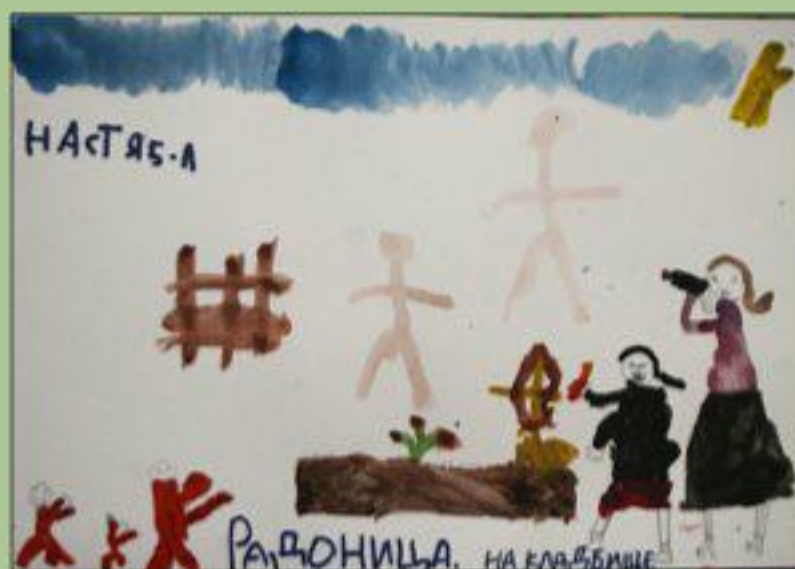
Рисунок Насти Лохоновой, 5 лет