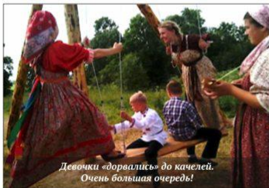
Девочки «дорвались» до качелей. Очень большая очередь!

Праздник длился 3 дня и был посвящен историческим событиям времен Смуты. Тогда в этих землях разбойничали банды поляков, напавших на Русь. Местный герой Устим Крошило сохранил церковные ценности от разбойников и, когда выгнали