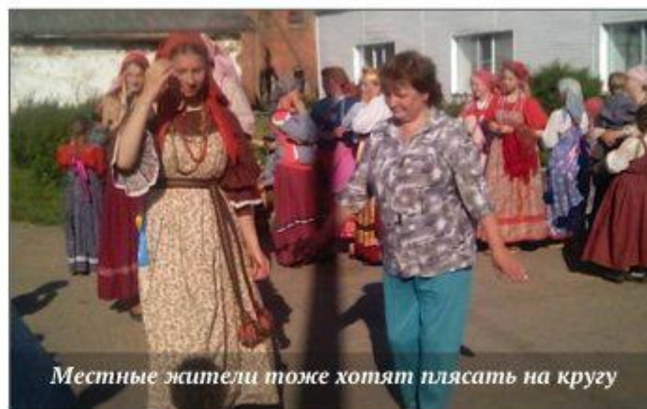
Местные жители тоже хотят плясать на кругу