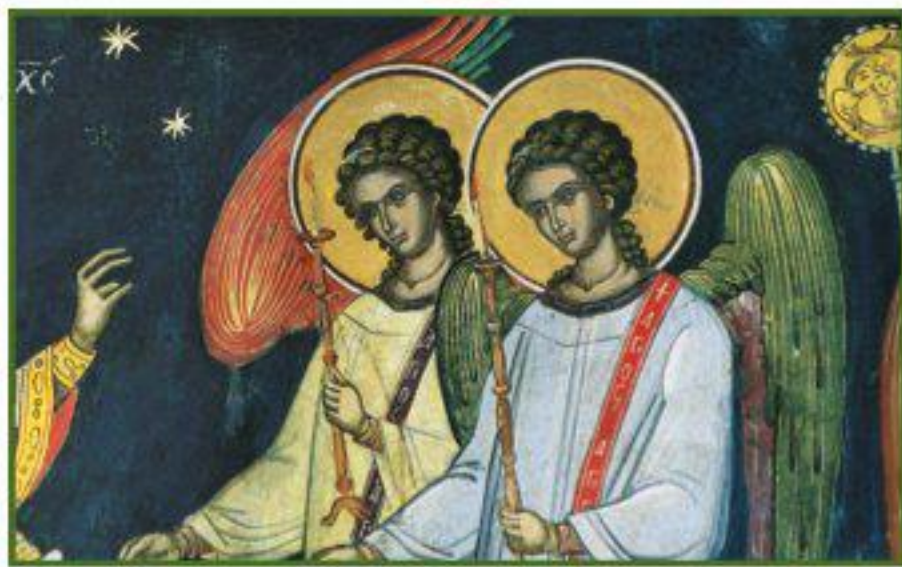
Литургия. Фреска афонского монастыря Дионисиат (XVI в.)

Вот куда приравнял себя человек! К Архангелам, Херувимам! Исканискал, с кем бы сравняться в выражении благодарности? Кто бы еще так пылал желанием хвалы? А вот — Серафимы! («серафим» — значит «пламенный»). И не задумалась Церковь — по любви своей пламенной — поставить себя наряду с ними. Что может быть выше этого?