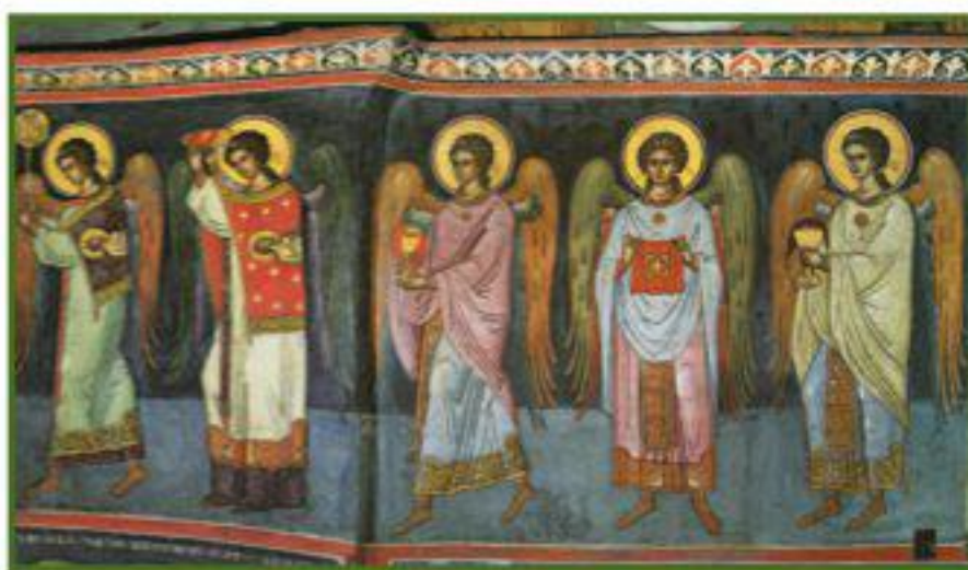
Литургия. Фреска афонского монастыря Дионисиат (XVI в.)

здесь эти мысли о благодарности выражены еще яснее, здесь уже раскрывается, за что именно «достойно» (греч. — подобает, должно) поклоняться: «Достойно и праведно и лепо (приличественно, соответственно, согласно) великолепию Святыни Твоея, Тебе (Тебя) хвалити, Тебе пети, Тебе благословити, Тебе кланяться, Тебе благодарити, Тебе славити»... Смотрите, как Церковь сразу же не наговорится словами благодарения! Шесть слов разных об одном и том же чувстве хвалы. Не так ли бывает при благодарности и с людьми? Не говорим ли и мы: «Я уж не знаю, как вас и благодарить. Не умею, и слов не нахожу, чтобы выразить вам то, что я чувствую за вашу милость. Но поверьте мне, я очень, очень вам признателен. Вовеки не забуду вашей доброты» — и т. д. и т. д. Сердце, переполненное благодарностью, хочет излиться в горячих и богатых речах. И если Церковь нашла шесть различных слов для выражения чувства хвалы, значит, сердце ее