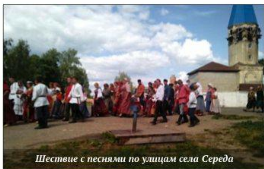
Шествие с песнями по улицам села Серeda