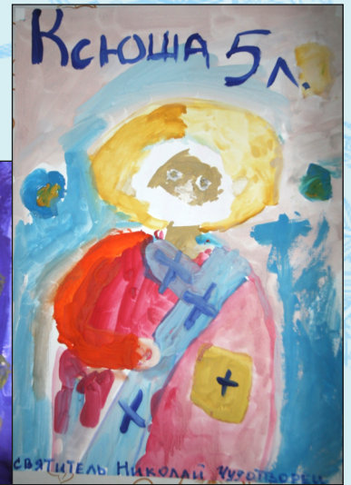
СВЯТИТЕЛЬ НИКОЛАЙ. Ксюша, 5 лет