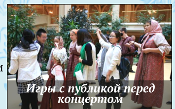
Игры с публикой перед концертом