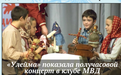
«Улейма» показала получасовой концерт в клубе МВД

И наша работа не прошла даром. Фольклорным сообществом нам была оказана большая честь: 15-16 ноября фольклорно-