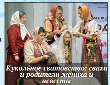
Кукольное сватовство: сваха и родители жениха и невесты

«Улейма» показала получасовой концерт в клубе МВД. А дальше нам доверили разогрев публики перед выступлением звезд российского фольклора, и мы играли с публикой перед концертом в зале церковных соборов Храма Христа Спасителя. Самыми активными зрителями оказались китайцы! На поездку мы собирали средства на нашем сайте и страничках в соцсетях. Большое спасибо всем, кто откликнулся на этот призыв. Отдел культуры администрации Борисоглебского МР в короткие сроки изыскал средства для оплаты дороги всему коллективу. Особенно благодарим мам особых детей, которые пожертвовали средства на эту поездку — вы за своими трудностями не забываете о помощи ближним! Яркие и незабываемые впечатления детей — самый лучший показатель того, что наши усилия не пропали зря.