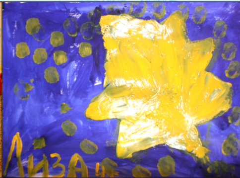
РОЖДЕСТВЕНСКАЯ ЗВЕЗДА. Луиза, 4 года