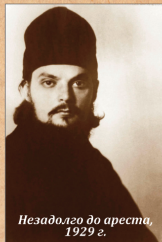
Незадолго до ареста, 1929 г.

К концу 1932 г. срок ссылки истек, но освобожде- ния не последовало. А 8 марта 1933 г. отца Сергия вновь арестовывают и заключают в тюрьму в Вологде. Возбуждено дело об «антиколхозной агитации среди населения местных деревень», приговор – пять лет ис- правительно-трудовых лагерей. Сперва лесопильные