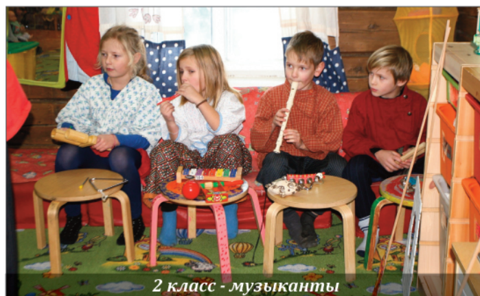
2 класс - музыканты