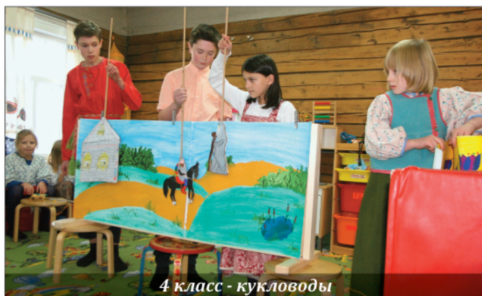
4 класс - кукловоды