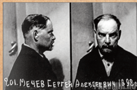
Фотография из последнего следственного дела. Ярославль, 1941 г.